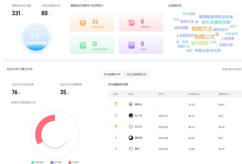
A-全班学生整体学习情况诊断图

支撑下的全程监测学生学情，精准发现学生知识结构缺陷，提供个性化学习路径指导，图 1-3 为知识图谱课程学习的学情分析，图 1-4 为基于问题的学习路径规划，学生基于解决不同问题的需求，实现个性化学习。