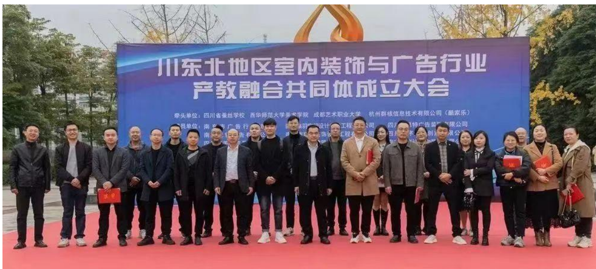
图 5-1 川东北室内装饰与广告行业产教融合共同体成立大会在我校隆重举行

全国丝绸行业产教融合共同体，我校当选为副理事长单位。依托共同体优质教育资源将全面促进我校深化产教整合，有效促进校企双元协同育人，实现技术技能人才培养与行业企业需求紧密对接，更好地服务丝绸纺织行业企业需求。