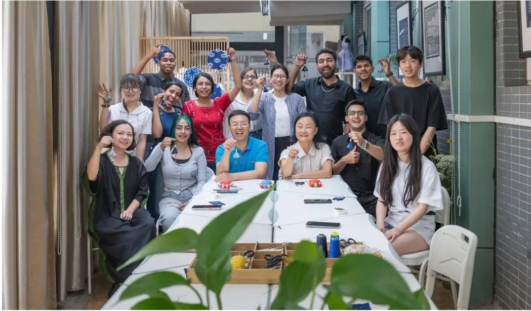
图 4-1 学校校长、技艺培训教师与川北医学院留学生合影