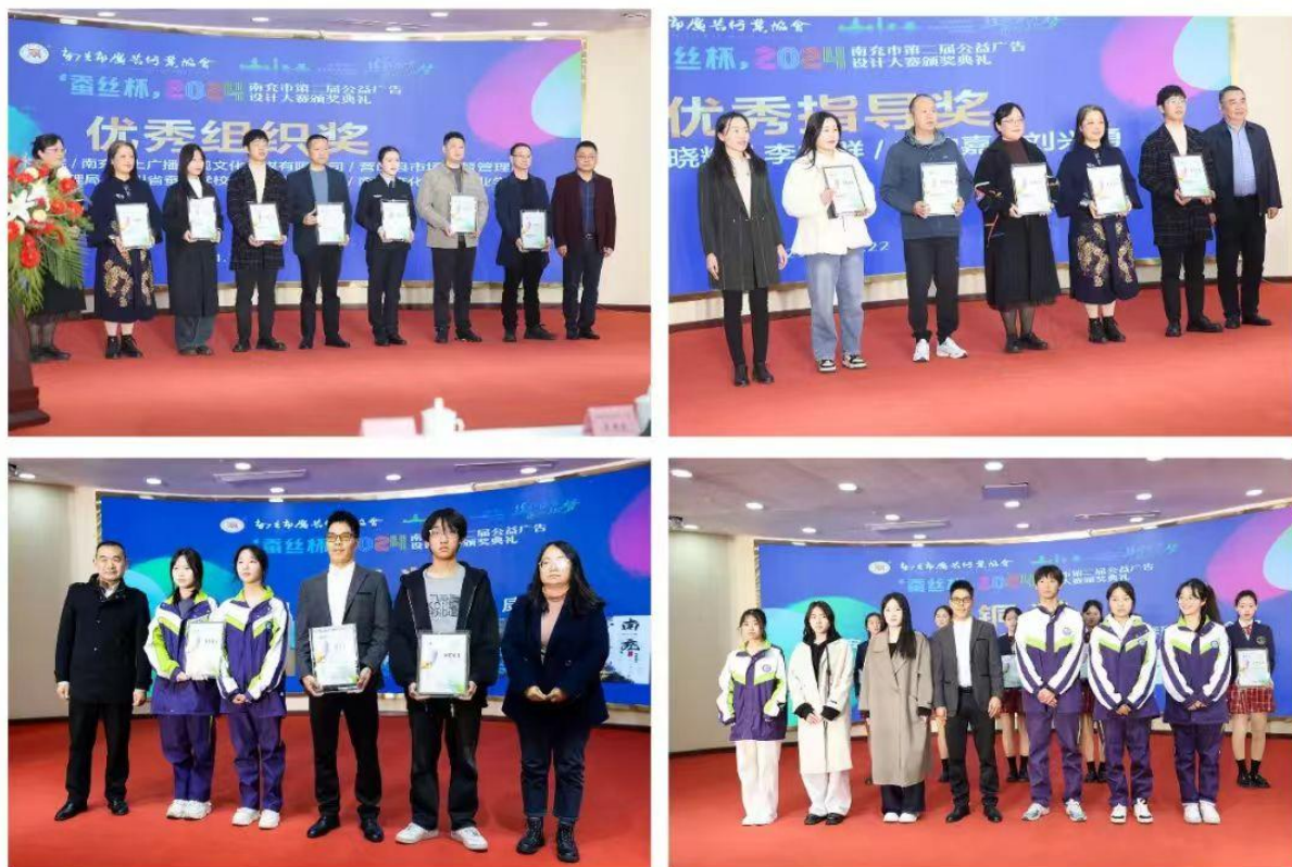
图 2-1 学校党委书记以及获奖师生在颁奖典礼