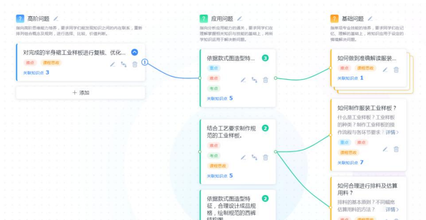
图 1-2 基于问题图谱的学习路径规划